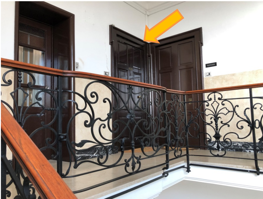
pianerottolo / accesso alloggio

Lotto 1-unico lotto -: appartamento, al 6° ed ultimo piano, con vano cantina al piano cantinato